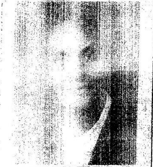
01/1/ ህይወት ልማት

ይህ የእማማ ጸሐይ ተላማ ምትካ ክፍል ምስክርነት ነው። በሰላም ዕትም እማማ ጸሐይ መሆኑን ለያህከረከሩ